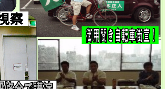
御用聞き自転車街宣!