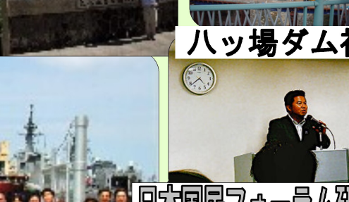
日本国民フォーラム研修会で講演