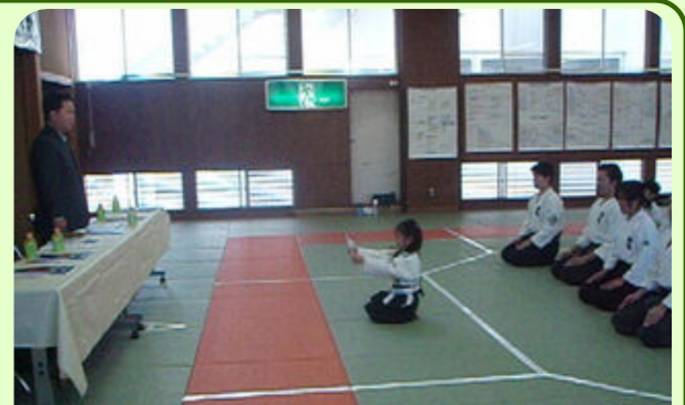
志木市剣道協会会長として活動