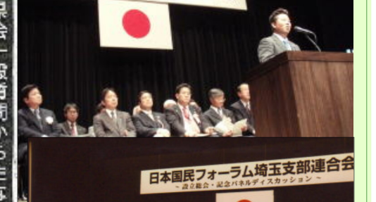
本国民フォーラム 発足記念総会