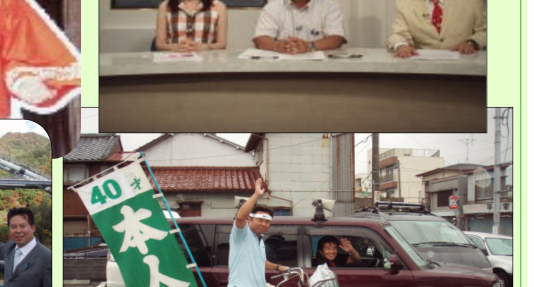
御用聞き自転車街宣!