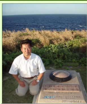
サイパン島 戦没者慰霊