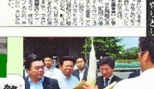
鹿児島、宮崎、沖縄視察