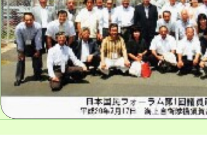
日本国民フォーラム第1回職員研修会 平成20年7月17日 海上自衛隊横須賀基地 於