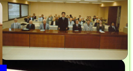
本国民フォーラム 発足記念総会