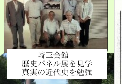
埼玉会館 歴史パネル展を見学 真実の近代史を勉強