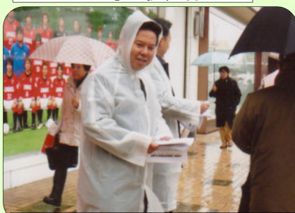
北朝鮮人権侵害問題啓発週間 (浦和駅前チラシ配布) -拉致問題解決のための署名集め-