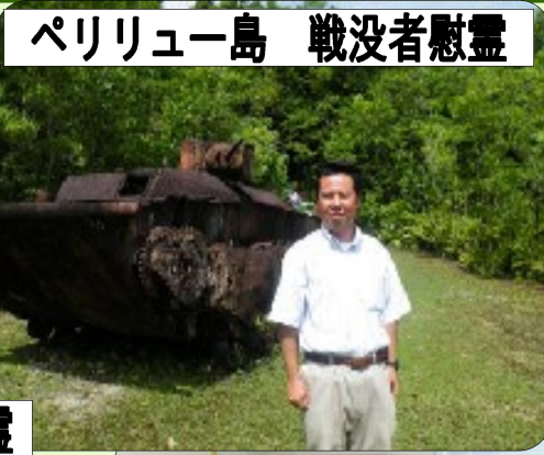
ペリリュー島 戦没者慰霊