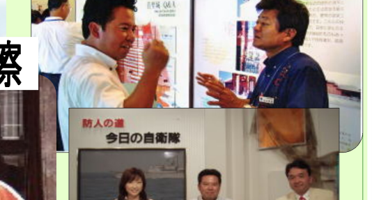
本国民フォーラム 発足記念総会