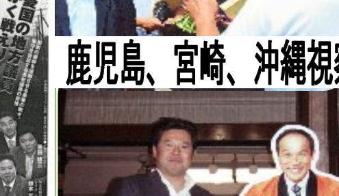
鹿児島、宮崎、沖縄視察