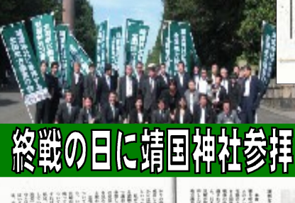
終戦の日に靖国神社参拝