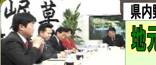
TV出演 チャンネル桜（討論番組） ～地方から中央へ攻め上れ 草莽崛起を实践する地方議員たち～