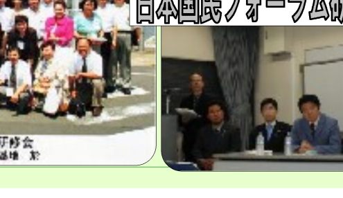
日本国民フォーラム研修会で講演