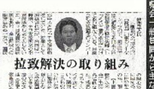
拉致解決の取り組み