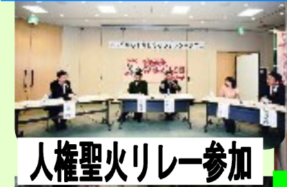
人権聖火リレー参加