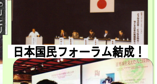
日本国民フォーラム結成!