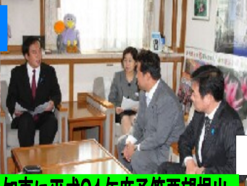
知事に平成21年度予算要望提出