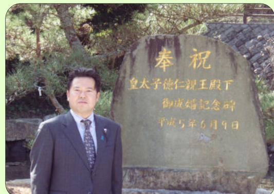
埼玉県議会 対馬有志団長として対馬視察